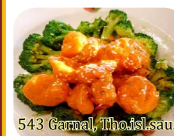
543 Garnal, Tho.isl.saus