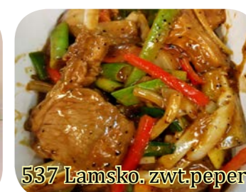
537 Lamsko. zwt.peper