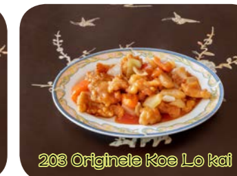
203 Originele Koe Lo kai