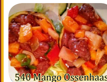
540 Mango Ossenhaas