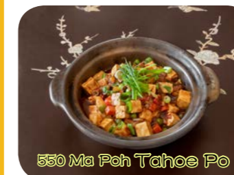
550 Ma Poh Tahoe Po