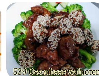
539 Ossenhaas walnoten