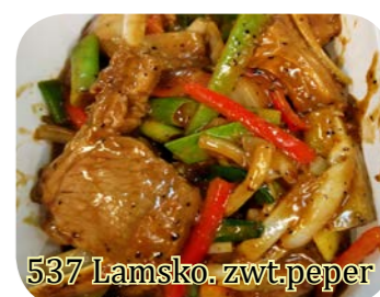
537 Lamsko. zwt.peper