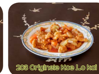
203 Originele Koe Lo kai