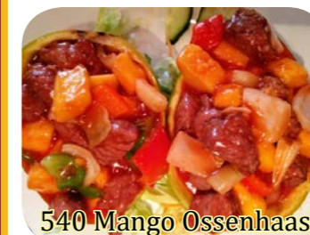
540 Mango Ossenhaas