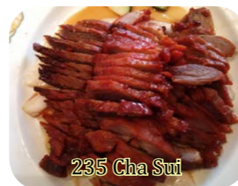
235 Cha Siu