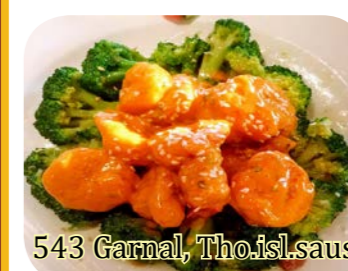
543 Garnal, Tho.isl.saus