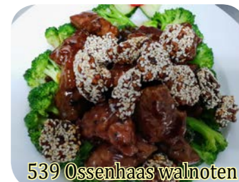
539 Ossenhaas walnoten