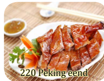
220 Peking eend