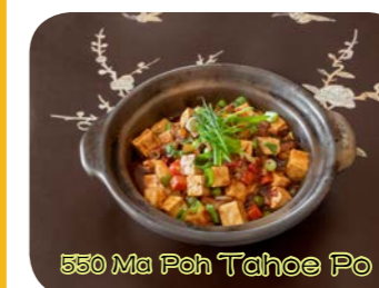
550 Ma Poh Tahoe Po