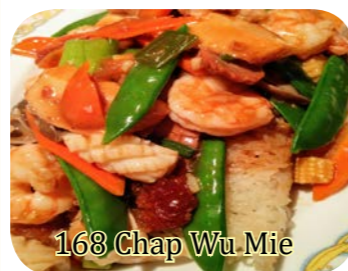
168 Chap Wu Mie